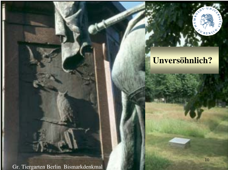
Gr. Tiergarten Berlin Bismarckdenkmal