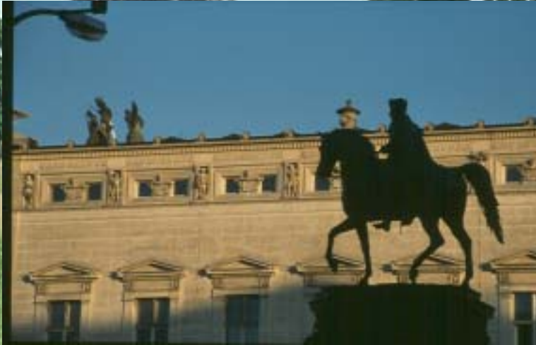
T. Becker Natur- und Denkmalschutz