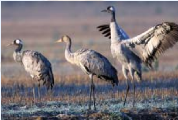
Kranich-Familie in der Morgensonne.