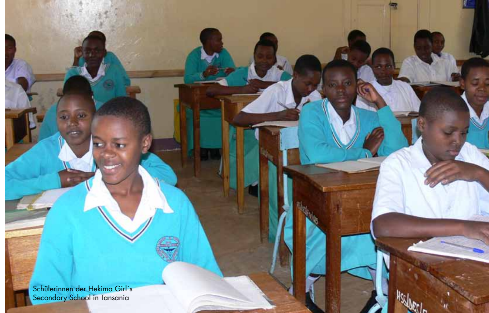
Schülerinnen der Hekima Girl's Secondary School in Tanzania