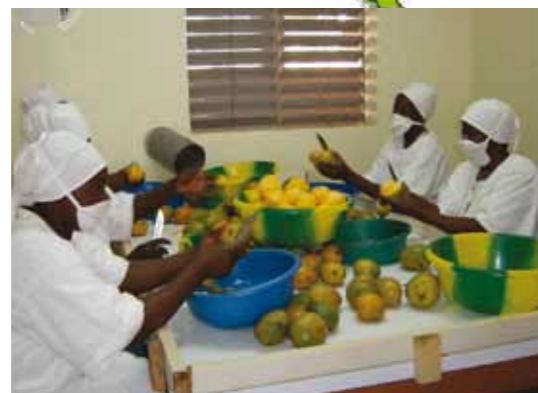
Kleinkreditfonds für die Frauen einer Mango-Trocknergruppe, Burkina Faso; Association des veuves et orphelins du Houet Yatimin Jigi (AVOH)