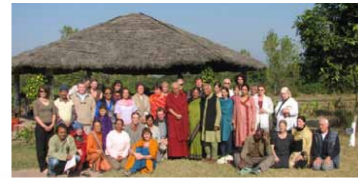
Erhalt der Artenvielfalt, Projekt „Seeds of Hope“ für gentechnikfreies Saatgut, Indien; Navdanya Trust