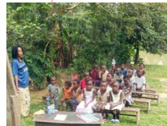
Mutter-Kind-Projekt, Schule für Waisenkinder, Hilfe zur Selbsthilfe, Demokr. Republik Kongo; Verein zur Unterstützung des Mutter-Kind-Projekts Kisangi e.V. (KISANGA)