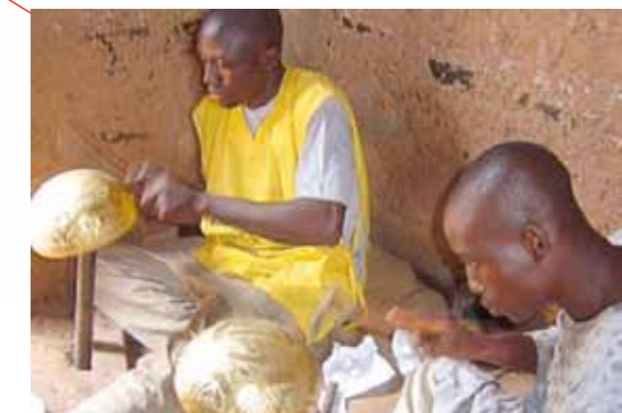
Pilotprojekt „Solarzellen statt Kerosin“, Strom und Licht für Arme in Botbadjang, Kamerun; International Solar Research Center (ISC e.V)