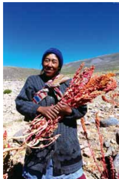
Quinoa-Anbau, Entwicklung ökologischer Produktionssysteme für indigene Familien, Bolivien; Agronomes & Vétérinaires sans frontières (AVSF)