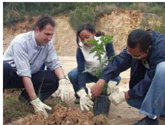
Schutz der Biodiversität, Pflanzung „lebender Zäune“ am Fúquene-See, Kolumbien; Fundación Humedales/Global Nature Fund (GNF)