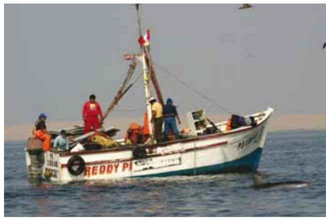
Delfinschutz, Wiederaufbau Meeresschutzzentrum Pisco, Peru; Gesellschaft zur Rettung der Delphine e.V. (GRD e.V.)/ ACOREMA