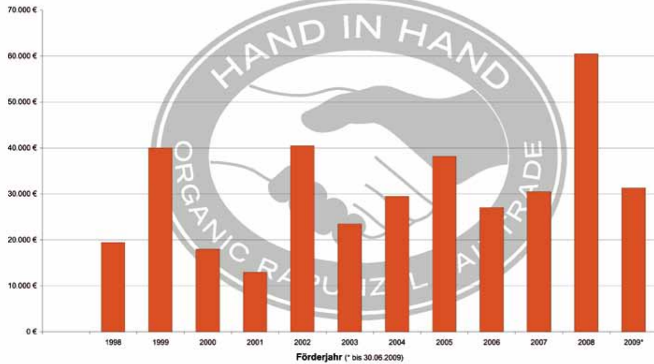
Projektzuschüsse des HAND IN HAND-Fonds