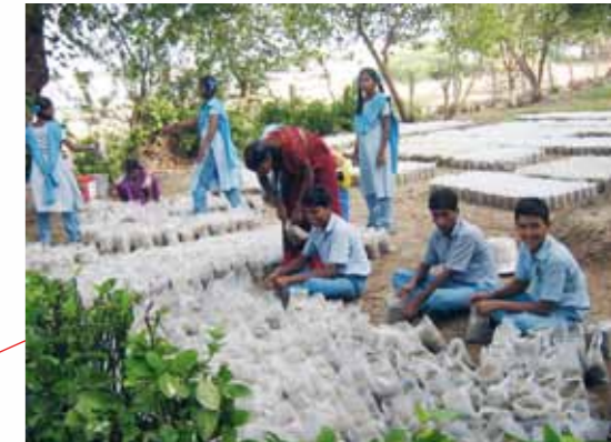
Umweltbildungseinrichtung, Baumschulen zur Wiederansiedelung von Mangroven – ein Post-Tsunami-Projekt am Pulicat See, Indien; Centre for Research on new intern. Economic Order (CReNIEO)/Global Nature Fund (GNF)